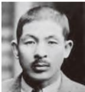
ประธานคนแรกของ ทีดีเค คุณเคนโซ ไชโตะ

ขณะที่ยังไม่แน่ใจว่าผลิตภัณฑ์ "เฟอร์ไรท์" จะสามารถทำตลาดได้หรือไม่ เขาต้องใช้ "ความกล้า" เพื่อจะไปให้ถึง "วิสัยทัศน์" และด้วยความร่วมมือจาก สถาบันเทคโนโลยีแห่งโตเกียว ผลิตภัณฑ์ที่เรียกว่า "เฟอร์ไรท์ คอร์" จึงได้เกิดขึ้นและออกขายไปทั่วโลกในปี พ.ศ. 2480 โดยผลิตภัณฑ์นี้ได้ถูกนำไปใช้กับเครื่องมือสื่อสารและวิทยุไร้สายของญี่ปุ่น เมื่อสิ้นสุดสงครามโลกครั้งที่ 2 ทีดีเคได้ขายผลิตภัณฑ์นี้ไปกว่า 5 ล้านหน่วย เป็นการสร้างพื้นฐานของความไว้วางใจให้กับบริษัท การคิดค้นผลิตภัณฑ์ใหม่ๆ ที่ทรงคุณค่านี้ ทำให้ ทีดีเคมีชื่อเสียงเรื่องการคิดค้นมาตั้งแต่เริ่มต้น และยังคงเป็นจุดแข็งของบริษัทจนถึงปัจจุบันนี้ และเป็นที่มาของคติพจน์ของบริษัท "มีส่วนร่วมส่งเสริมวัฒนธรรมและสังคมด้วยความสร้างสรรค์" มาตั้งแต่ปี พ.ศ. 2510